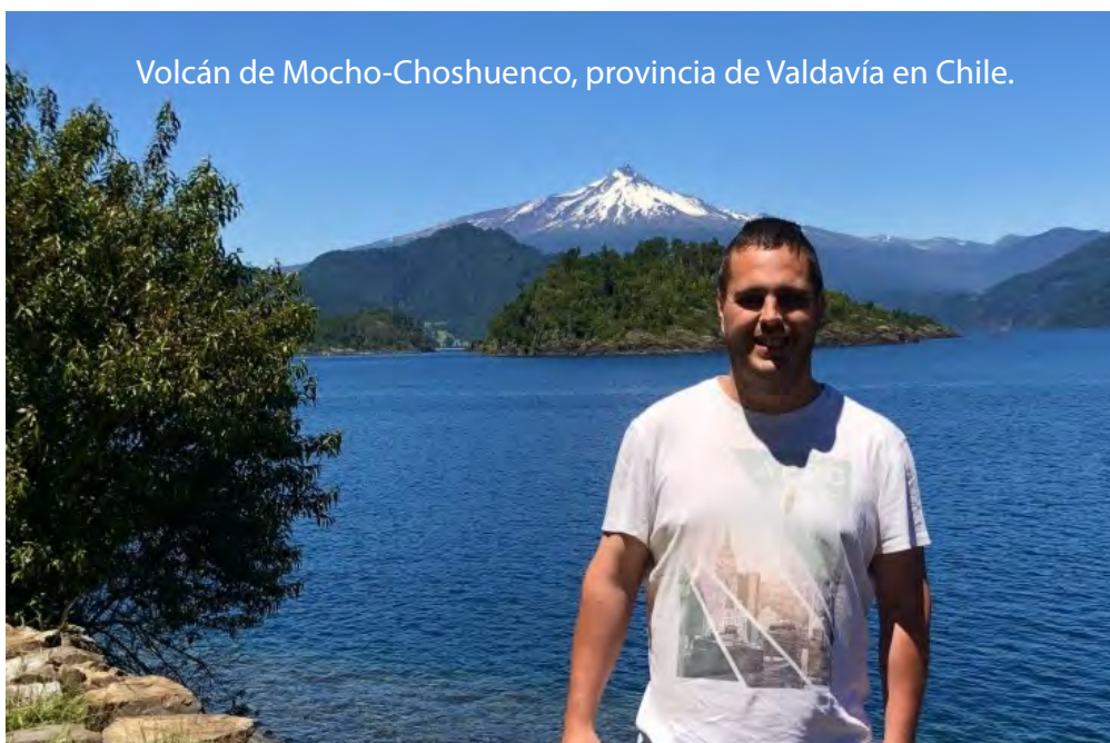
Volcán de Mocho-Choshuenco, provincia de Valdivia en Chile.