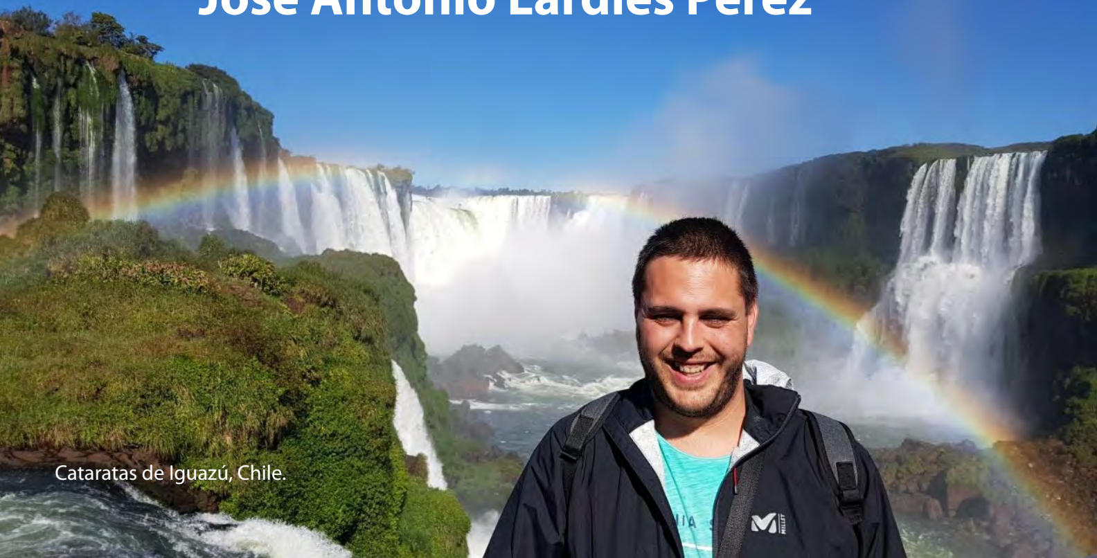
Cataratas de Iguazú, Chile.