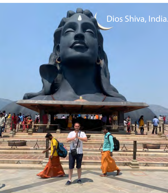
Dios Shiva, India.